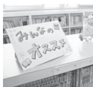
明るい雰囲気のある学校図書館

支援員さんやボランティアさんが来てくれる日を子どもたちは、楽しみにしています。古い本の整理や読み聞かせの活動など、学校図書館は、さまざまな皆さんにかかわっていただき、支えられています。