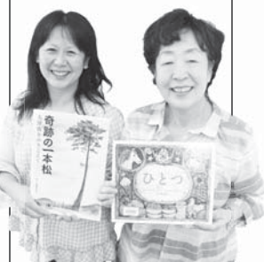
学校図書館ボランティア

市内の小中学校4校で支援員として、本の整理などを行っています。蔵持小学校にも週に1度来ています。先生や地域のボランティアさんと協力しながら、子どもたちに読書の大切さを伝えるお手伝いをしています。