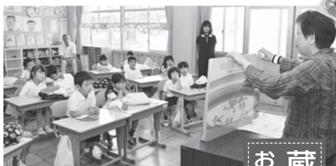
ボランティアさんの読み聞かせにみんな真剣