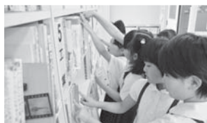
どの本にしようか?これ面白そうだよ!