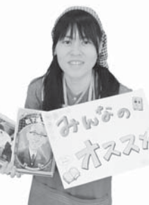
学校図書館運営支援員