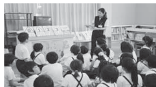
「本は大事にしよう」市立図書館からお話の日