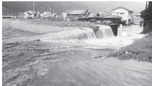
高さ9.4mの輪中堤(特定区域の周囲を囲むようにつくられた堤防)を越え、住宅地へと水が侵入していった(昨年9月3日午後5時ごろ)