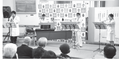
病院職員によるミニコンサート

この日は、医師や看護師が仕事の合間をぬって練習したという管楽器の演奏や、最新鋭医療機器の見学ツアーなど、15周年をきっかけに、市立病院を市民の皆さんにもっと知ってもらおうという病院スタッフ手づくりの催しが繰り広げられました。