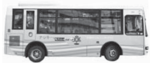
市街地循環型コミュニティバス「ナッキー号」

発行/名張市企画財政部広報対話室 〒518-0492 名張市鴻之台1-1 ☎0595-63-7402 ✉pr@city.nabari.mie.jp ㊚http://www.city.nabari.lg.jp