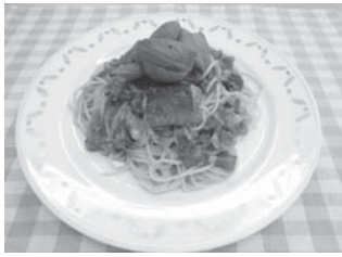
サバ缶のトマトパスタ (2人分)

4月から新しく医師が着任します。今回紹介できなかった新しい医療機器と合わせて、「広報なばり4・4号」でご紹介します。