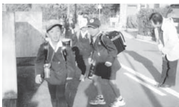
小学校でのあいさつ運動

市内の小・中学校の早朝あいさつ運動、子育て支援、地域との連携を深めるためのミニ集会、三重刑務所や三重県保護会など更生保護施設に物心両面にわたる援助協力、「社会を明るくする運動」への参加協力などの活動をしています。