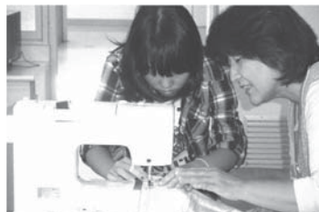
家庭科の授業を見守る（ほめほめ隊）

毎月1回休日にイベントを開催。遊びを通じ、子どもたちの創造、独立性などを養います。