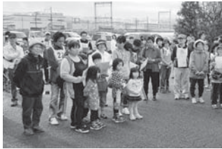
ウォークラリー (❶・④)