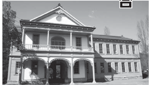
▲明治村に移築され展示されている「旧蔵持小学校校舎」

蔵 持地域は、市の中心に位置します。蔵持町里・蔵持町原出・蔵持町芝出・蔵持町東・蔵持町西の6区で構成され、約3500人が住んでいます。近鉄桔梗が丘駅周辺の都市機能と、自然豊かな田園風景が混在する恵まれた特性を持ち、蔵持工業団地や大型商業施設、 武道交流館いきいきなどの公共施設があります。大阪のベッドタウンとしての機能を持ち、新旧住民が生活文化を共有し、歴史と新しい価値観の融合でさらなる飛躍が求められている中、「誰もが安心して住み続けられるまちづくり」を目指して4つのまちづくりビジョンを策定しました。