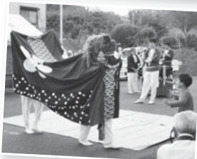
地域の文化を守る 短野地区の「獅子神楽」

川西・梅が丘地域は、梅が丘小学校校区を該当区とする川西5地区(短野、下三谷、夏秋、松原、大屋戸)と梅が丘地区との共同体です。川西地区は1300年以上の歴史のある地区であり、一方、梅が丘地区は、昭和60年7月より入居が始まった新興住宅地です。現在、川西・梅が丘地域全体で約2500世帯、7500人の住民が住んでおり、平均年齢は42歳です。