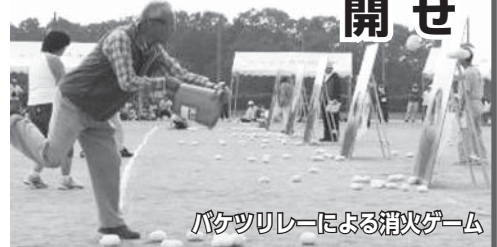
バケツリレーによる消火ゲーム