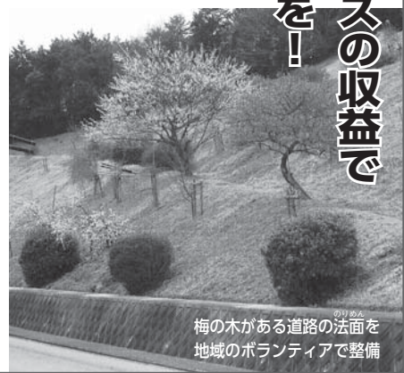
梅の木がある道路の法面を地域のボランティアで整備