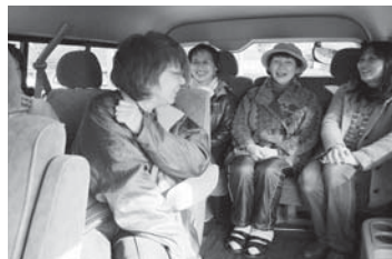
車内は、高齢者のふれあいの場（ゆりバス）