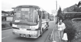
コミュニティバスみどり号 (❹・③)