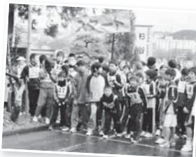
過去19回開催 「笑ろうて走ろう会」

なかでも、毎年1月2日に開催している杉谷神社を発着とした地域内5キロを走る「笑ろうて走ろう会」は毎年多くの参加者があり、地域に根付いたイベントとなっています。