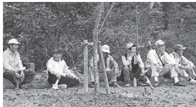
自分たちの地域への理解を深めると同時に、昼食などを共にすることで、お互いの親睦も深まっています。

ひなち地域ゆめづくり委員会が発足から3年後、平成17年に4つの専門部会を立ち上げました。その中で福祉部会は、やるべきことが多く、事業の選定に困難を極めました。初年度の委員たちが、熟考の末、「福祉」以前に、まずは住民同士が知りあう事が先決と、「ひなち地域の歴史探訪」を始めました。