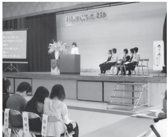
15年にわたり続く「こころの思い発表会」。子どもたちの発表を通して、地域住民が子どもたちを理解し、それぞれが距離を縮めるきっかけとなっています。

10年前に「将来の夢」を語った子どもも成人し、「好きなことを思い続け、周りの人に話したり作文にしたりすることで、夢はより一層鮮明になり、実現に近づける」とメッセージをくれました。