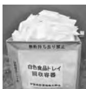
資源は回収容器からあふれ出ないように…