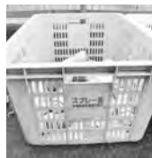
スプレー缶専用回収容器