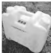
廃食油専用回収容器