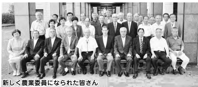
新しく農業委員になられた皆さん