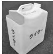
ライター専用回収容器