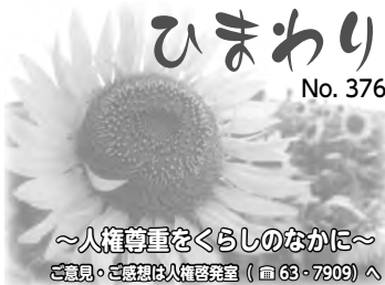
～人権尊重をくらしのなかに～ ご意見・ご感想は人権啓発室(☎63-7909)へ

しかし、そんなわたしに現在、 禁煙継続中です。まもなく一年に なろうとしています。まもなく一年に なろうとしています。まもなく一年に なろうとしています。まもなく一年に なろうとしています。