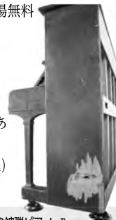
武道交流館いきいきで展示中の被弾ピアノ