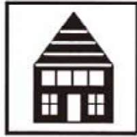
世帯員数 1世帯あたり 2.7人