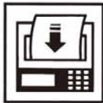
転入 1日 6.2人