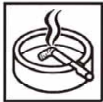
たばこ消費量 成人1人あたり 1,726本