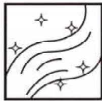
し尿処理量 1日 104.5kℓ