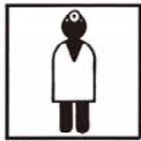
医師 人口10,000人あたり 10.7人