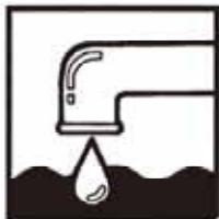
上水道 1日使用量 26.9千m 3