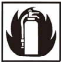
火災 15.9日 1件