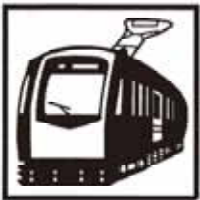
私鉄 乗車人員1日 13,641人