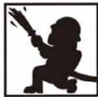
消防職員 市民745人に1人