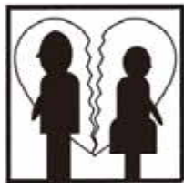
離婚 1日 0.4組