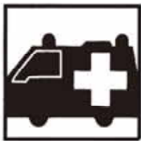
救急車出動 1日 8.1件