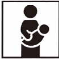
出生 1日 1.8人