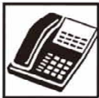
電話 1世帯あたり 0.8台