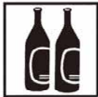
酒類消費量 成人1人あたり 13.9ℓ