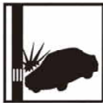
交通事故 1日 7.3件