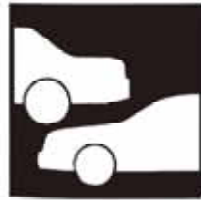
自動車 1世帯あたり 1.8台