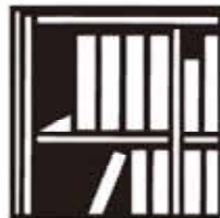
図書館 1人あたり 3.5冊