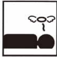
死亡 1日 1.9人