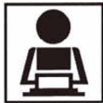
市職員 市民90人に1人 (市立病院含む)