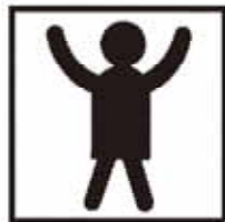
個人市民税 成人1人あたり 55,102円