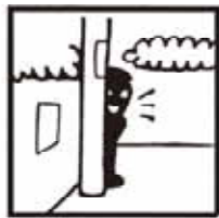
刑法犯罪 発生 1日 2.3件 検挙 1日 0.9件