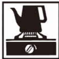
ガス使用量 1日 66.4千m 3