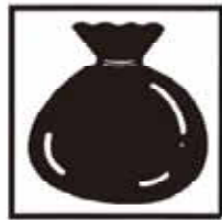
ごみ処理量 1日 可燃物 45.0t 不燃物 5.3t 資源ごみ 8.5t