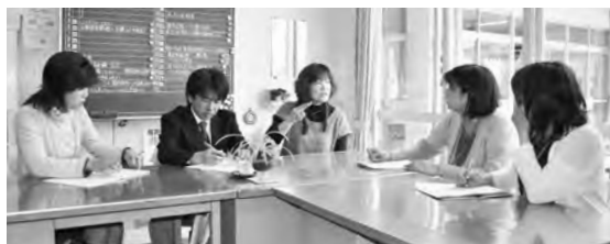
4月から保健師や保育士、教員などが保育所(園)、幼稚園、小学校を訪問。個々の子どもの特性や必要とされる対応などを話し合う体制を築いている。

発行/名張市企画財政部広報対話室 〒518-0492 名張市鴻之台1-1 ☎0595-63-7402 ✉pr@city.nabari.mie.jp 🌐http://www.city.nabari.lg.jp