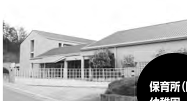
子ども発達支援室は、元田辺三菱製薬㈱研修所内に設置しています。