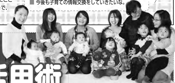
▲3月の「はじめて広場」に参加いただいた皆さん