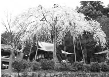
名張市赤目町長坂 延寿院 しだれ桜