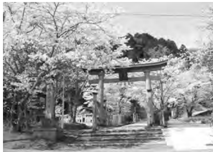
伊賀市長田 射手神社