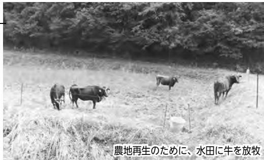
農地再生のために、水田に牛を放牧