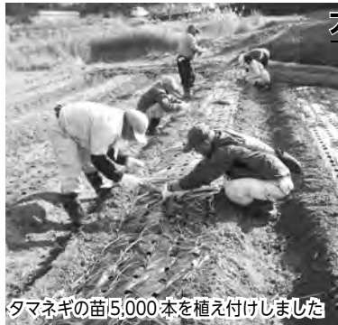
タマネギの苗5,000本を植え付けしました