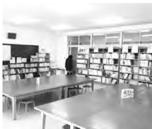
名張小学校図書館

A 学校に図書館が置かれている意味や重要性をいま一度考える。支援員の役割を検証し、さらなる充実に取り組む。現在、名張市読書推進計画を検討している。