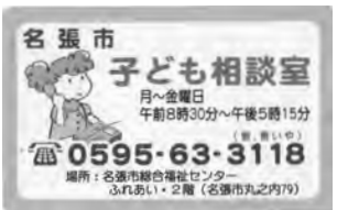
児童相談に関するご案内

A 名張市要保護児童対策地域協議会を設置し、各構成機関が連携して要保護児童の早期発見と適切な保護や、その家族への支援を行っている。伊賀児童相談所との連携を密にし、地域との協力の中、痛ましい事件の防止に対応している。