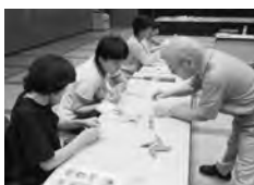
前期のふれあいサロン道場の様子

場所 総合福祉センターふれあい 定員 各20人 申込期間 10月4日(月)～15日(金) ※先着順。定員になり次第締め切り 申込方法 名張市社会福祉協議会に備え付けの申込用紙に必要事項を記入し、直接または、電子メール (info@nabarishakyo.jp)、ファクス(64-3349)でお申し込みください。