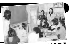
少人数でめきめき

自然に囲まれた小さな学校です。現在、全校児童数41人で、そのうち35人が特認校制度を利用しています。