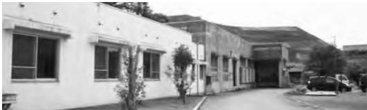
津市にある三重県動物愛護管理センターには、県内10カ所の保健所から、それぞれ週に1回、犬や猫が運び込まれる。

保健所に収容された犬(子犬)成犬の里親になりませんか、犬の譲渡事業。対象は、県内在住で、犬を飼う条件が整い、現在犬を飼っていない、家族全員の同意の下で最期まで飼うことができる人です。また、三重県動物愛護管理センターで開催される「飼う前教室」を2時間程度受講(譲渡希望者以外も受講可)などの条件があります。詳しくは伊賀保健所(☎24・8080)へ。