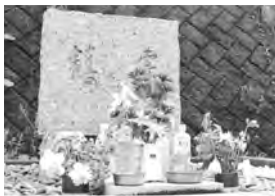
敷地内にある慰霊碑には、職員などにより花が供えられていた。

子猫が生まれる春から夏ごろまでは、1日に100匹を超える猫がセンターに運び込まれることもある。