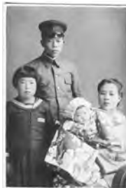
兄が出征する直前に撮った、兄夫婦と姪そして妹が写った写真。兄は戦死、妹と姪は、赤目口駅空襲で亡くなる。

二人は、小学校の講堂に運ばれたということで、わたしもすぐに小学校へ向かいました。講堂一面に、けが人と亡くなった人が並べられていました。 隣組の人が戸板に乗せて二人を家まで連れて帰ってくれたのですが、二人の姿を見て両親が『悲しすぎて、涙もでない』と言ったことが今でも心に残っています。戦争で長男、次男は出征し、三女と孫まで亡くした両親はどれだけ辛かっただろうと思うと、戦争はあつてはならないこと、この世から戦争が無くなってほしいと願います。