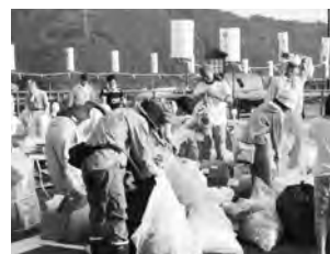
▲翌朝、地域の皆さん、ボランティアの皆さんが約2トンのごみを回収

名張川納涼花火大会が、7月24日、「響」をテーマに開催され、5万人が3000発の花火に酔いしれました。