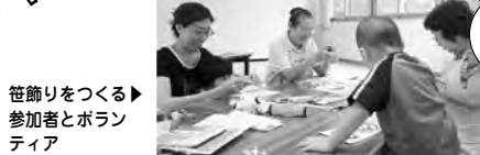
笹飾りをつくる▶参加者とボランティア