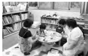
◀おりがみて遊ぶ様子

名張市おもちゃ図書館では、年に数回「おもちゃばこ」と称して、土曜日に開館しています。7月3日には、ボランティアと参加者が七夕の笹飾りを一緒に作って交流を深めたり、たくさんのおもちゃで遊んだりして、楽しいひと時を過ごしました。