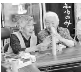
万華鏡を作る様子

このサロンは、環境にやさしく、準備や片づけをみんなで簡単にできるように、参加者全員が「マイカップ」を持参することを約束としています。