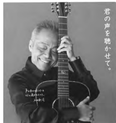
君の声を聴かせて。

7月には「社会を明るくする運動」 強調月間です。これは、すべての 国民が非行の防止と罪を犯した人 たちの更生について理解を深め、 それぞれの立場において力を合わ せ、犯罪や非行のない安全で安心 な地域社会を築こうとする運動で す。