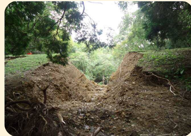
平成25年9月、台風18号による大雨により決壊したため池

ため池は全国におよそ21万箇所あり、古くから農業用水の貯水池として利用されてきましたが、その多くは築造から100年以上が経過し、老朽化が進行しています。さらに、近年多発している局地的な大雨や地震などの自然災害が重なることにより、ため池が決壊し、人命や財産などに大きな被害をもたらす危険性が高まります。