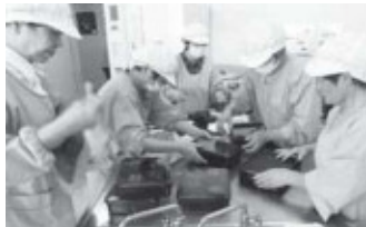
配食サービスを担うボランティア

地域の配食サービスは、高齢などの理由により調理が困難な人を定期的に訪問し、調和のとれた食事を提供する。調和のとれた食事を提供するとともに安否確認・健康状態の確認を行う事業。平成23年度は649人に年間2万食余りを提供していた。行政の配食サービスと同様、一人暮らし高齢者を身守り、安心安全な地域生活を支えている。名張市社会福祉協議会と連携を図り支援に努める。