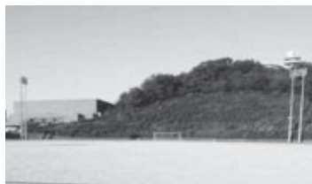
名張市陸上競技場

新たな施設の整備は難しいが、サッカー人口は増加しており、サッカー施設の整備は必要だ。陸上競技場の再整備を含め、全体的な整備計画を作る必要がある。