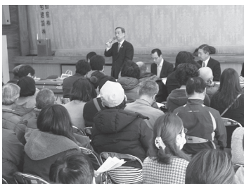
適正化後期実施計画についての説明会

基本方針は変えられないが、後期実施計画はあくまで案であり、住民と話し合い、納得できるものにしていく。