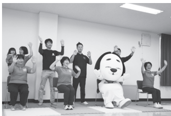
名賀医師会が考案した「よくバリ青春体操」

雇用・就業においては、シルバー人材センターを活用し、情報発信や相談窓口として機能させ働きやすい環境づくりに取り組む。市民の健康づくりには、「名張健康マイレージ制度」の本格実施や「よくバリ青春体操」の普及に努め、健康で意欲も能力もある高齢者が、元気で仕事や趣味に生きがいを感じる社会づくりを目指す。