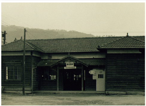
旧伊賀線の西名張駅

駅で、そのまま名張高校の前を通り現在の蔵持公民館の所に蔵持駅がありました。蔵持駅を抜けると大阪線と並走し、ちょうど桔梗が丘駅の裏を通り、県道57号線と並走しながら現在の北中学校近くの西原駅へ続いていきます。南西原の伊賀コリドールロードの高架のところで大阪線と立体交差をし、やがて小波田川に差し掛かります。そして新田の水田地帯を抜けると「貴人塚」近くに美旗新田駅がありました。新田を出ますと新田水路の土手に差し掛かり、昨年まで一部残されていたトンネルをくぐり、最後に伊賀神戸駅に至り現在の伊賀線へと続きます。 旧伊賀線の面影は、50年の歳月とともにほとんどが失われましたが、往年を偲ぶ線路敷きは市内各地に今も残されています。東町から桔梗が丘駅へ続く線路敷きを利用した道路はいくつかの小さな橋が架けられています。この橋を下から見上げると鉄橋の骨組みが橋を支えているのを確認できます。 これからの行楽シーズン、名張の近代化を支えてきた旧伊賀線敷きを散策してみてもどうでしょうか。