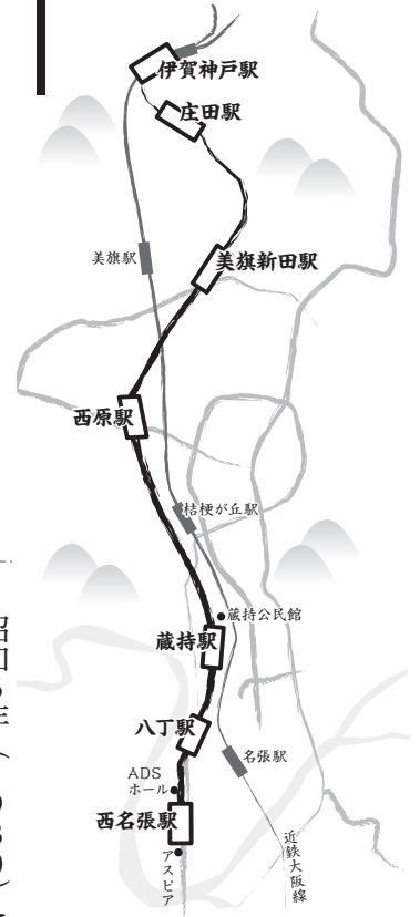
旧伊賀線の沿線図