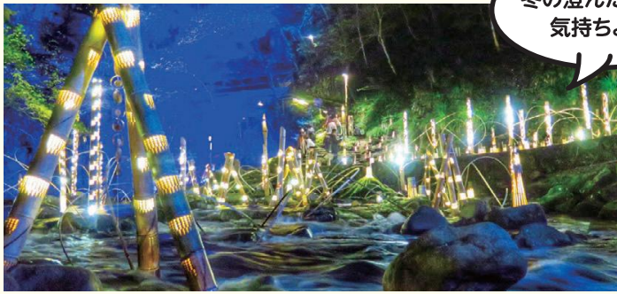
※「幽玄の竹灯」は1月31日(日)までの開催です。