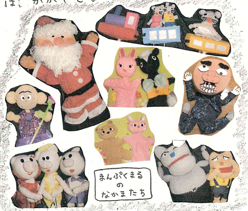
まんぷくまる の なかまたち