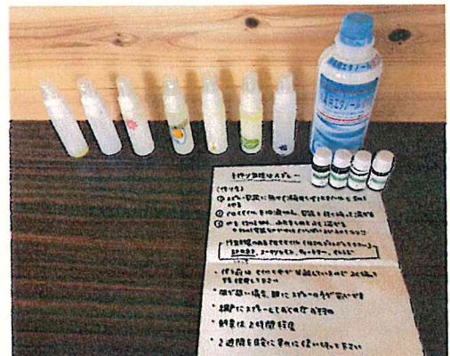
手作り虫除けスプレー

さくらんぼでは、いつでも メンバー募集中です！！ 見学だけでも大歓迎です！！ ぜひ一度気軽に遊びに来てくださいね