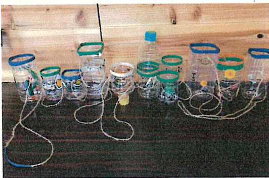
ペットボトルシャワー