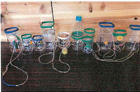
ペットボトルシャワー

次回活動日程 7月19日(木) 蔵持市民センター和室 牛乳パックフォト フレーム作り