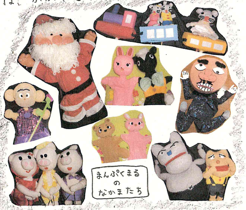
まんぷくまる の なかまたち