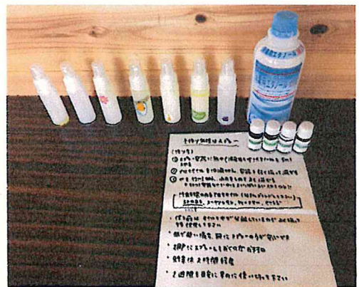
手作り虫除けスプレー

さくらんぼでは、いつでも メンバー募集中です！！ 見学だけでも大歓迎です！！ ぜひ一度気軽に遊びに来てくださいね