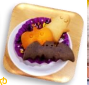
栄養バランスが崩れた給食や 行事食、美味しい手作りおやつも！