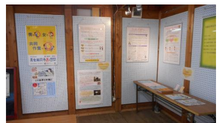
《パネル展の様子》 市役所ロビー(左) やなせ宿(右)