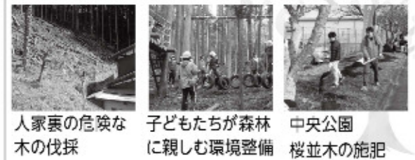
人家裏の危険な木の伐採 子どもたちが森林に親しむ環境整備 中央公園 桜並木の施肥