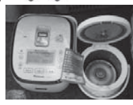
袋に入っていない