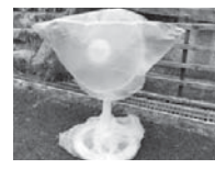
複数の袋に入れている