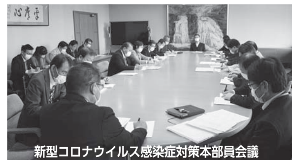
新型コロナウイルス感染症対策本部員会議

市では、新型コロナウイルス感染症対策本部を設置し、国・県の動向、感染者の状況などを踏まえながら、感染予防・感染拡大の防止に取り組んでいます。今後、国の緊急経済対策に基づく生活支援策や地域医療体制の確保に向けた取組について、三重県など関係機関と連携して進めていきます。最新情報は、広報紙や報道機関への情報提供のほか、即時更新が可能な市ホームページやSNS（フェイスブック・ツイッター・ユーチューブ）を通じて、発信します。