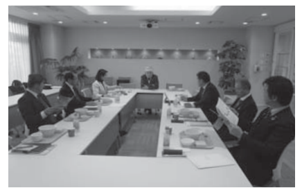
北原リハビリテーション病院での視察