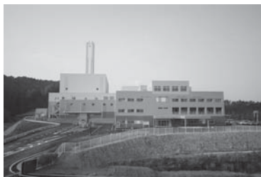
伊賀南部クリーンセンター

復旧費用は約15億円を見込んでいる。方針としては焼損した施設全てを元通りにするのではなく、再発防止対策および施設の強靱化を考慮して可能な限り復旧費用を抑制する検討を行っている。