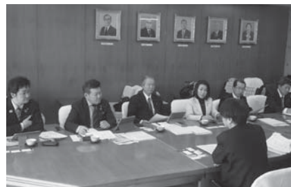
世田谷区教育委員会での視察

視察先 東京都世田谷区、千葉県鴨川市、東京都八王子市 視察期間 令和2年1月29日(金)～31日(日)