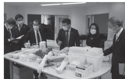
亀田総合病院での視察