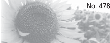
~人権尊重をくらしのなかに~ 意見投稿・男女共同参画推進室(☎63・7909)へ

大変やから、また僕が手伝うわ。」と話す息子は、とても満足そうに笑顔で話してくれたことを、とてもうれしく思いました。