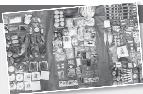
実際に市内で集められたごみ袋から出てきた食品ごみ。まだ開封されていない食品も多い。

宴会のはじめ30分と 終わり10分は食事を楽しもう 30・10運動 (さんまる・いちまる)