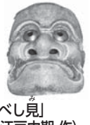
「大べし見」 (江戸中期作)