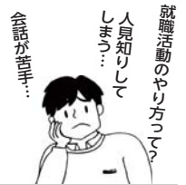
あなたをサポートします