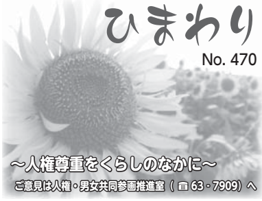
～人権尊重をくらしのなかに～ 意見は人権・男女共同参画推進室(☎63・7909)へ

な荷物の落下防止」などが目的だということが分かりました。それを読んで私は(確かにこの配慮はあまり考えてなかったな。『急いでいる人がいるから空ける』を当たり前だと考えていたけど、すべての利用者の安心安全を優先にしていこうと、世の中は変わってきたんだなと感じました。他にも、このような「当たり前」を見直すことで変わってきたこと