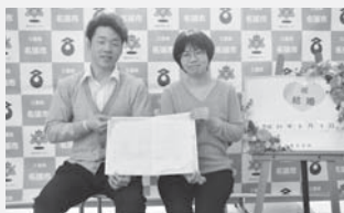
窓口のバックボードの前で記念撮影もできます

4月19日(金)から名張市オリジナル戸籍届書(婚姻届、出生届)を窓口で配布します。ご希望の場合は、お申し出ください。出生届は、市内産婦人科にも配布します。