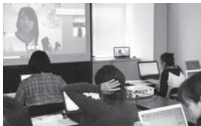
在宅ワークに向けたパソコン研修を開催

在宅ワークとは、自宅にいながらパソコンを使った入力作業などを行う仕事です。場所や時間にとらわれず、気軽に始めることができます。名張市産業チャレンジ支援協議会は、女性の新しい働き方を推進するため、東京のベンチャー企業（株）マミーゴーと協定を締結しました。