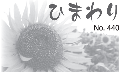
～人権尊重をくらしのなかに～ ご意見は人権・男女共同参画推進室(☎63・7909)へ

苦しい登り坂で、「こんにちはお先にどうぞ」と声を掛けてもらおうと、不思議と力が湧いてきます。「ありがとう」がとうとう溢れます。「譲る側と譲られる側、思いやりと感謝の気持ち」が交差し