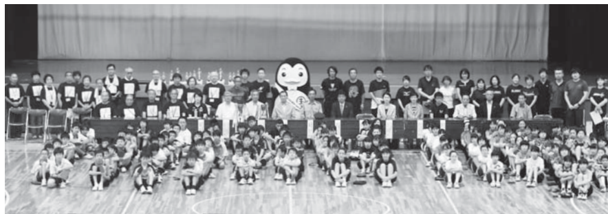
8月19日にHOS名張アリーナで開催した「伊藤和子杯中学生卓球大会」