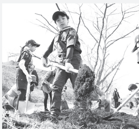
手分けをして桜の木の根元に肥料をまく参加者たち

桜まつり実行協議会ホームページ 🌐http://www.nabari.or.jp/sakura/