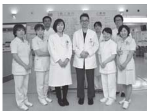
市立病院の乳腺外来のスタッフ

市内で乳がん検診を受けられるのは、寺田病院と市立病院、そして市役所などを会場として実施する集団検診です。