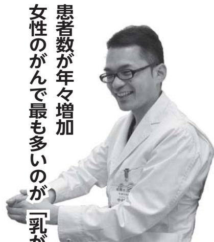
患者数が年々増加 女性のがんで最も多いのが「乳がん」

Q 科学的根拠がありません。ただし、放射線被爆を避けなければならぬ人やマンモグラフィ検査だけでは分かりにくい若い人などにとっては、超音波検査は有用です。医療機関では4000円の自己負担で超音波検査のみコースを設けています。また、集団検診では超音波検査を、自己負担1000円で受けられます。