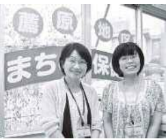
15の地域にあるまちなちの保健室

地域包括支援センターに多様なニーズに応える相談員の充実を図る。複合的な生活支援に対応できるワンストップ窓口の体制づくりや地域生活の課題に対応できるボランティア組織を立ち上げ、安心して暮らせる地域づくりを目指す。