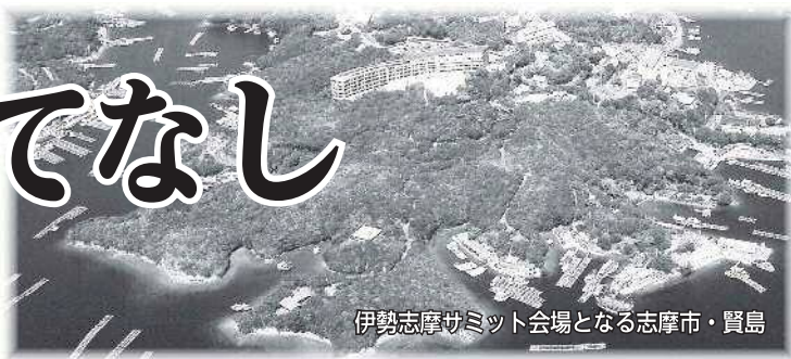
伊勢志摩サミット会場となる志摩市・賢島

5月26日・27日に三重県志摩市で開催される「伊勢志摩サミット」まで、あと1カ月となりました。本市でも、県全体でサミットが盛り上がるよう、サミットを通じて名張の魅力を国内外に発信します。