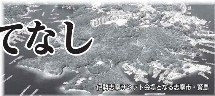
伊勢志摩サミット会場となる志摩市・賢島

5月26日・27日に三重県志摩市で開催される「伊勢志摩サミット」まで、あと1カ月となりました。本市でも、県全体でサミットが盛り上がるよう、サミットを通じて名張の魅力を国内外に発信します。