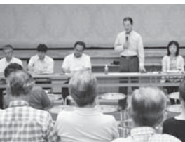
8月に桔梗が丘で行われた説明会

関係団体の皆さまへの説明会や市内3会場での市民説明会を開催し、市長が出席した。11月30日には、市内外の固定資産税の納税者予定者3万5千人の皆さまに文書で通知させていただいた。今後各団体や地域から要請があれば日程調整して出向きたい。