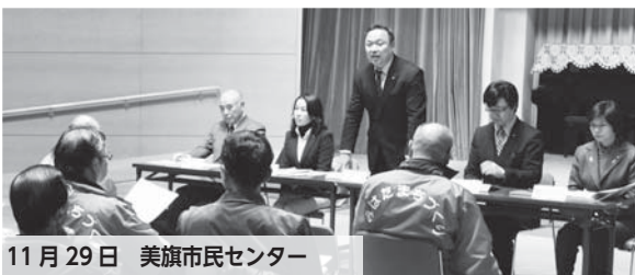
11月29日 美旗市民センター