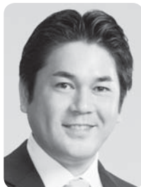
名張市議会議長 森脇 和徳