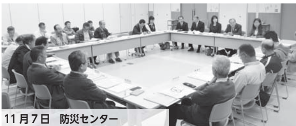
11月7日 防災センター

編集/議会広報特別委員会 発行/名張市議会 ●三重県名張市鴻之台1・1 ☎63・7834~5 ㊚64・8870 ✉gikai@city.nabari.mie.jp