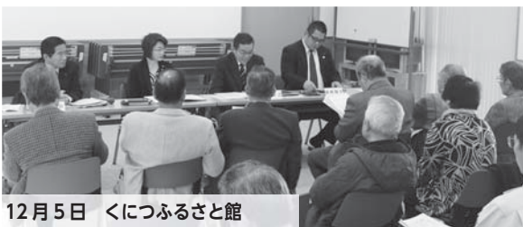
12月5日 くにつふるさと館