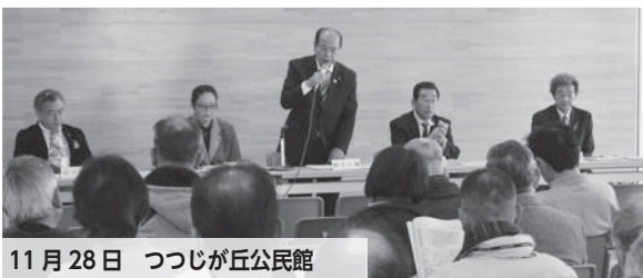
11月28日 つつじが丘公民館