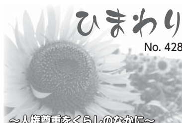
～人権尊重をくらしのなかに～

さて当日の朝、まずは起きた子どもたちの服を着替えさせて、顔を拭き、おむつを替えて、朝食を用意して食べさせます。3歳のお姉ちゃんは、食器を持ったまま動き回るので、あとを追いかけて食べさせなければなりません。