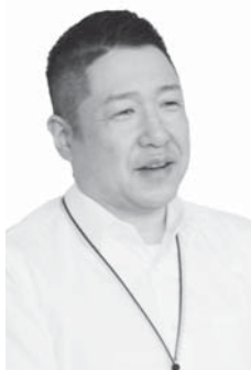
高齢・障害支援室 高齢者福祉担当室長