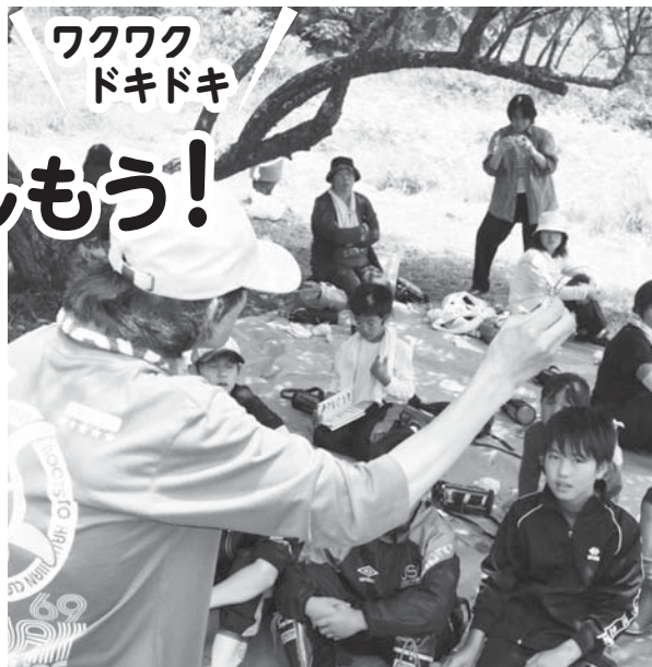
赤目自然学校の野外教室。自然のおもしろさの学習

この夏休み、普段できない体験や興味のあることにチャレンジして、とっておきの思い出作りをしてみよう。