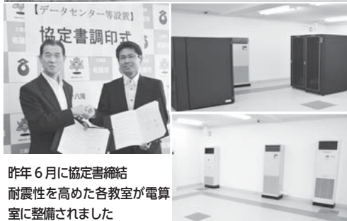
昨年6月に協定書締結 耐震性を高めた各教室が電算 室に整備されました

松阪市に本社のある(株)松阪電子計算センターを誘致しました。県内外の行政機関・民間のデータを管理する同企業は、データセンターをはじめとした事業展開で5月9日(土)から営業を開始します。