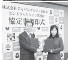
昨年12月に協定を締結

食品メーカーである(株)ジャングルメが、新商品の開発や物流の拠点「セントラルキッチン」として整備します。現在は開業に向けて準備を進めているところです。