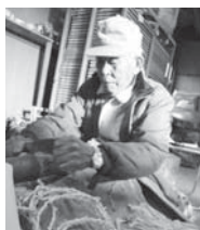
市内で1人となった火縄作り

伝統的産業、文化として伊賀焼・火縄・組組・伊賀酒などがある。伊賀米コシヒカリは4年連続特Aだ。独自の技術を持つ企業も多い。名張の産業振興、伝統文化芸術の継承のためにも、ものづくり条例の制定は意義のあることと承知している。制定に向かってスピード感をもって取り組みたい。